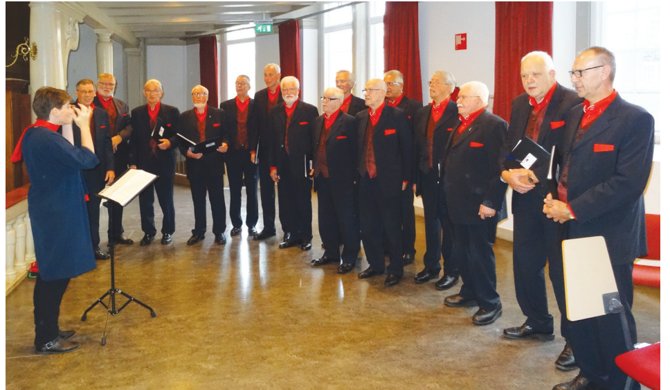
Deo Cantemus aan t ienzingen