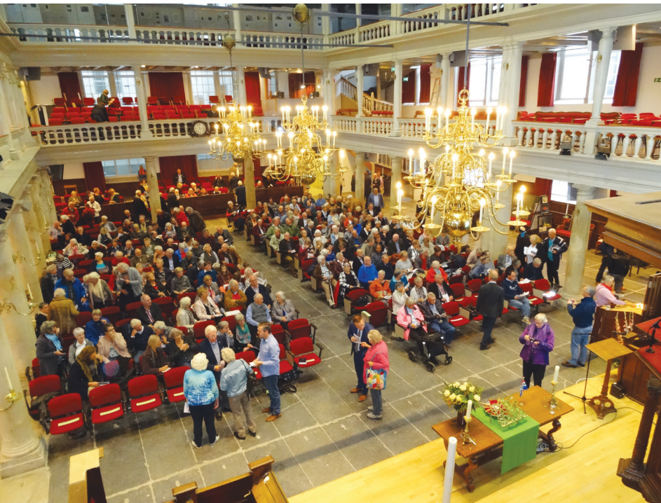
'wát n stuk volk'....