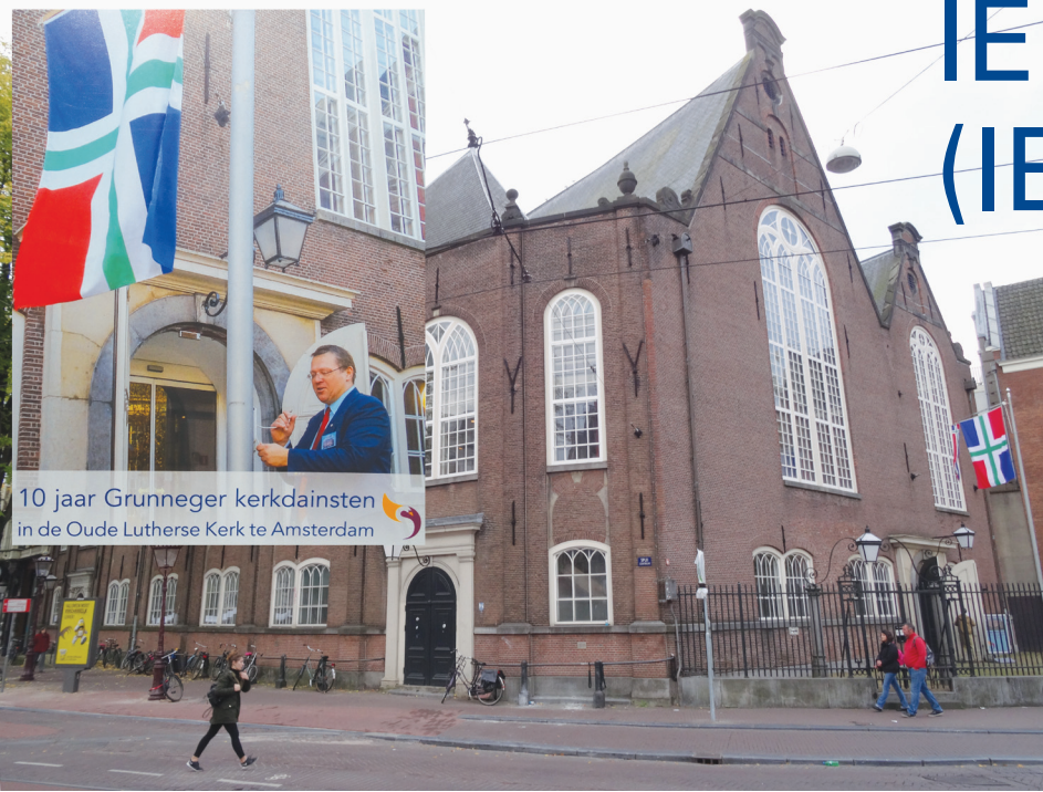
10 jaar Grunneger kerkdinsten in de Oude Lutherse Kerk te Amsterdam